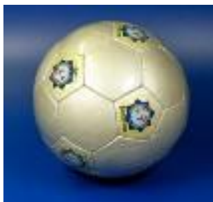
IPA Ball 10.- €