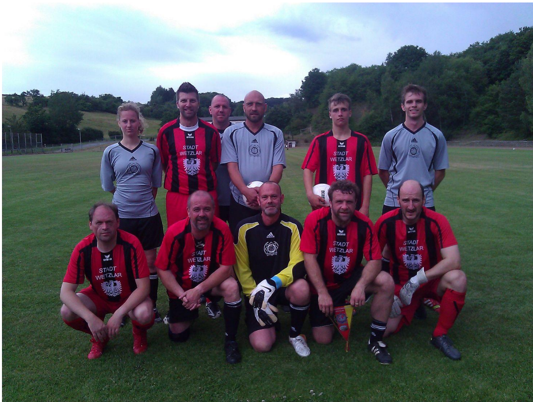
Die Spieler beim gemeinsamen Gruppenfoto. Einige Mitglieder haben bei Wetzlar mitgespielt. Na? Wer findet sie?

Hierzu traf man sich um 12.30 Uhr auf dem Sportplatz in Wetzlar - Naunheim. Es gelang der IPA Wetzlar, im Vergleich der beiden bunt und freundschaftlich gemischten Mannschaften, dann letztendlich doch den Sieg in einer Höhe von 7:6 davon zu tragen.