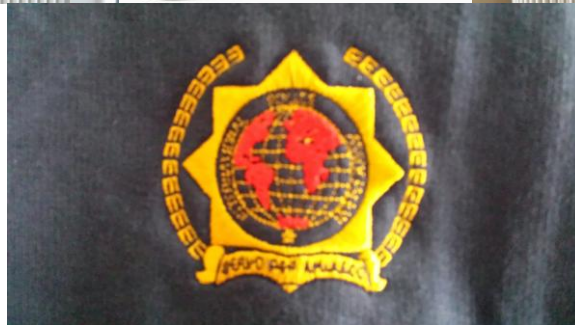
Das gestickte Wappen in Großaufnahme