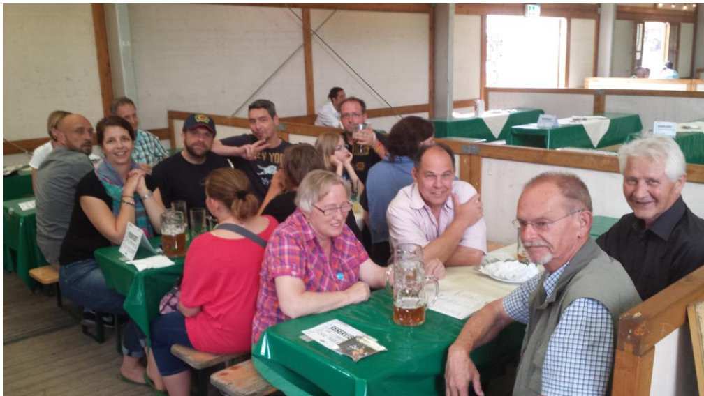
Gemütliche Runde beim Ochsenfest

Zum ersten Mal wurden auch unsere neuen T-Shirt und Poloshirt getragen. Diese kamen durchweg gut an.