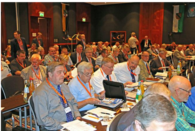
Ein kleiner Blick in die Runde der Delegierten

Falls jemand von euch noch weitere Einzelheiten haben möchte, oder gar die Zahlen des Rechenschaftsberichtes der Schatzmeister, kann sich an mich wenden. Ich hätte da einige DIN A4 – Seiten zum „schmökern“. Ihr findet aber auch Informationen auf der Homepage der Deutschen Sektion. Diese hat übrigens ein neues Design. Sehr schön und übersichtlich. Schaut mal rein!