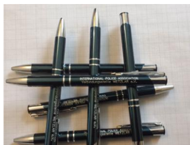
Kugelschreiber 1.- €