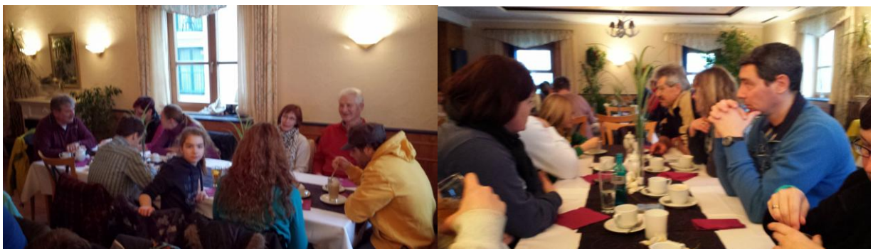
Beim leckeren Waffelessen nach der Wanderung