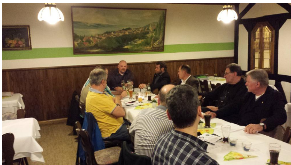
Blick in die Runde

Schade eigentlich, dass in diesem Jahr recht wenig Mitglieder zur Mitgliederversammlung gekommen waren. Es waren lediglich 13 Mitglieder da. Schade, aber auch verständlich, nach dem wichtigen Jahr 2013 war auch etwas Ruhe eingetreten. Ich werte die geringe Beteiligung als ein blindes Vertrauen, welches uns entgegen gebracht wird (Immer positiv denken!).