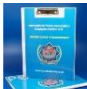
Klemm-Mappe 5.- €

Darüber hinaus haben wir aus den Altbeständen noch die gebrannten Fliesen. Hier erfolgt die Abgabe gegen eine kleine Spende. Die Höhe dürft ihr selbst bestimmen.