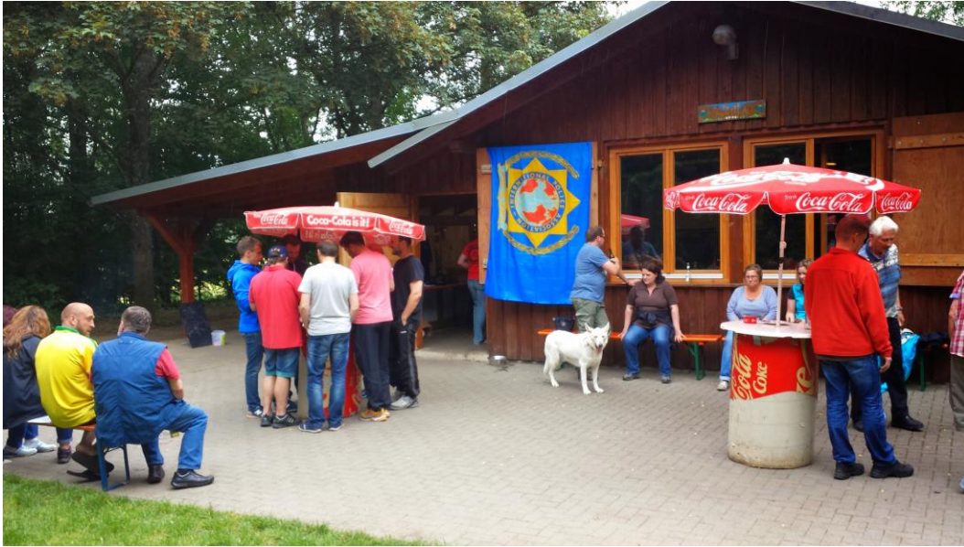
Bei herrlichem Wetter wurde über das Spiel diskutiert

Am Abend schaute man dann noch gemeinsam ein Spiel der Fußball WM aus Brasilien.