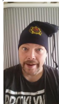
Mütze-/Schalkombination (10.- €)