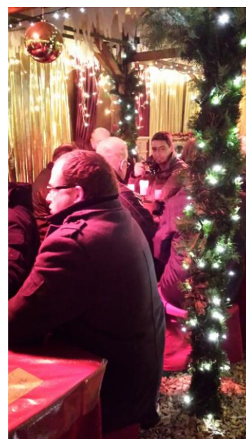
Bilder vom Treffen im Adventsdorf 2014