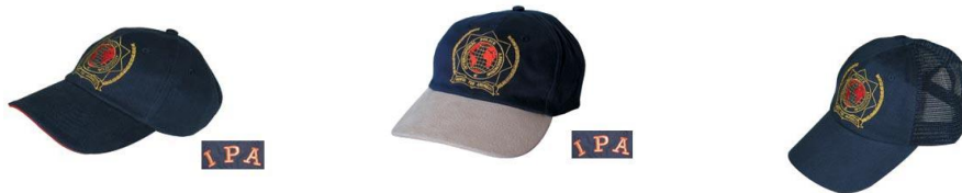
Das Klassische (5.-€)