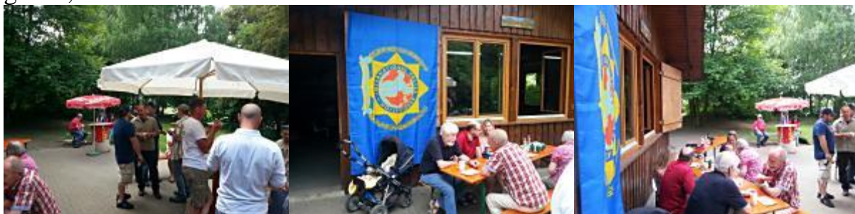
Was hatten wir ein Glück mit dem Wetter!

Die Rückmeldungen zu der Grillfeier, die bisher an den Vorstand heran getragen wurden, waren alle durchweg positiv. Demnach wird es wieder ein Sommergrillen geben, da wir da eventuell mehr Glück mit dem Wetter haben dürften.