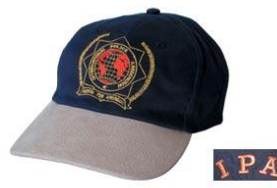
Das Besondere (10.-€)