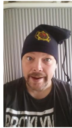
Mütze-/Schalkombination (10.- €)

Darüber hinaus haben wir aus den Altbeständen noch die gebrannten Fliesen. Hier erfolgt die Abgabe gegen eine kleine Spende. Die Höhe dürft ihr selbst bestimmen.