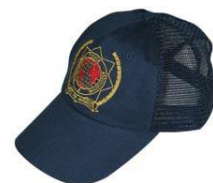
Das Luftige (5.-€)