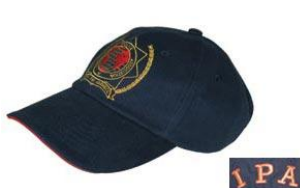
Das Klassische (5.-€)

Zu den bereits bekannten Artikeln zählen: